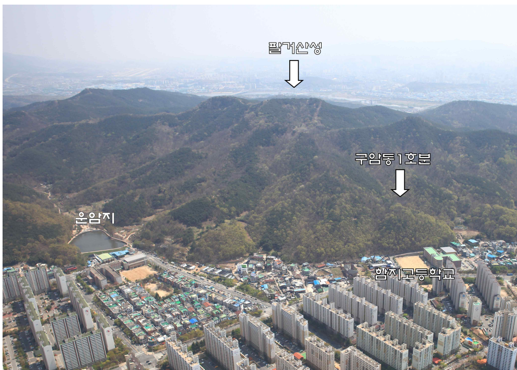
사진 3. 구암동고분군 · 팔거산성 전경