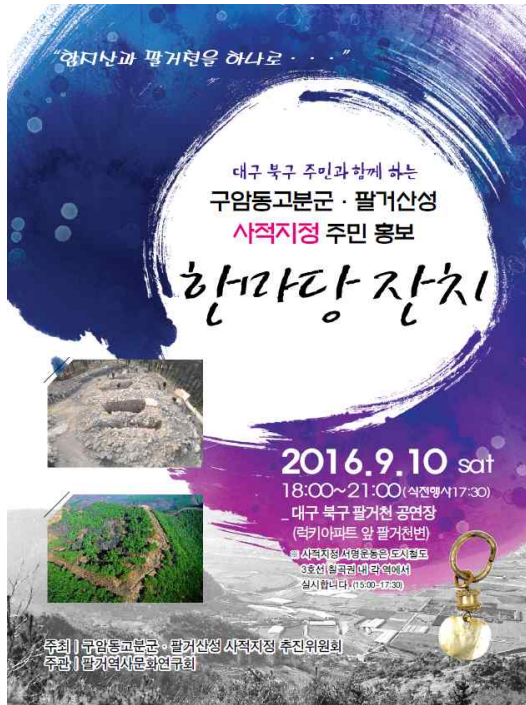
사진 1. 초청장 앞면