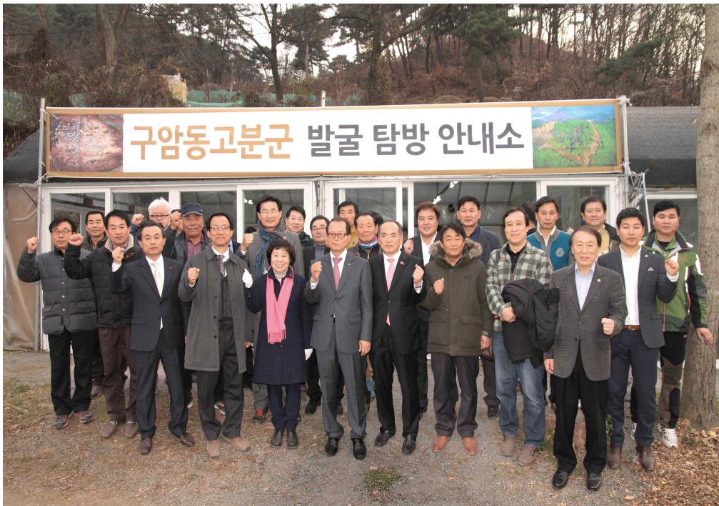
사진 5. 구암동고분군 발굴 탐방 안내소 문화재청장 방문사진