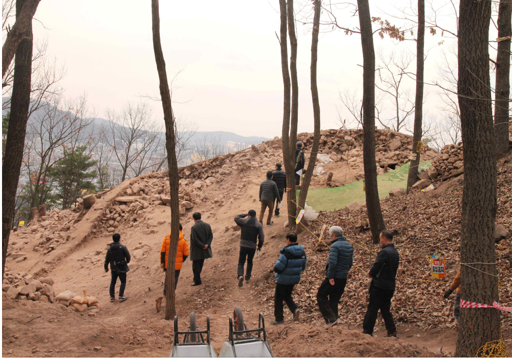
사진 6. 구암동고분군 현장 탐방 모습