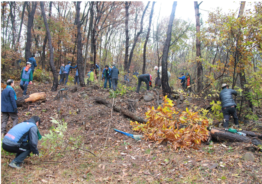
사진 7. 구암동고분군 유적보호활동