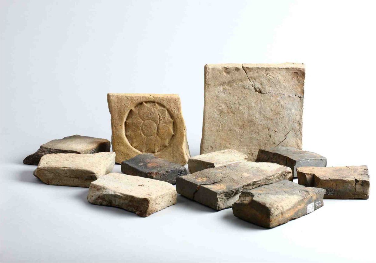
사진 4. 토기가마 1호 및 2호 상부출토 전