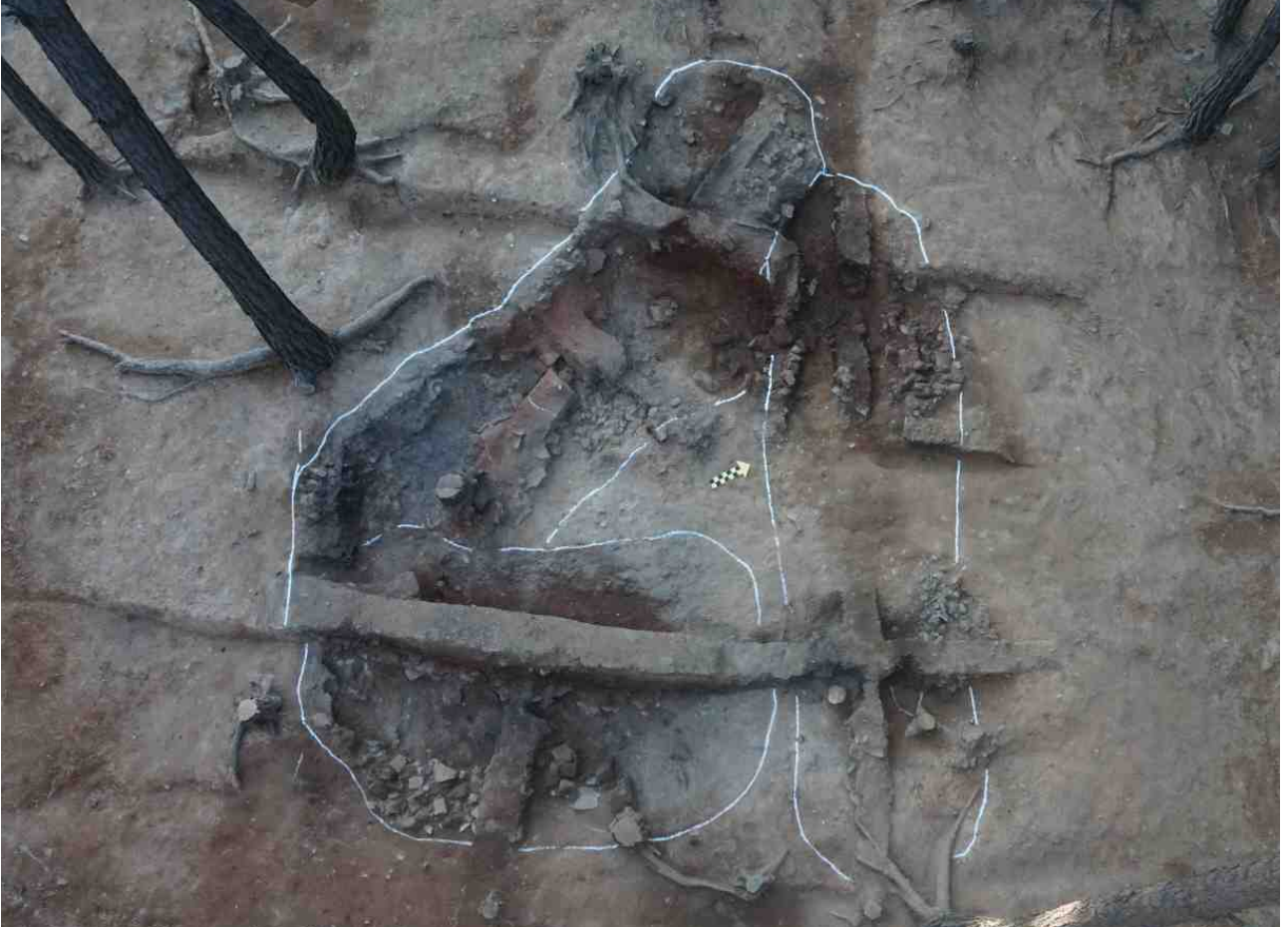
사진 1. 토기가마 1·2호, 수혈 1호 조사 전경