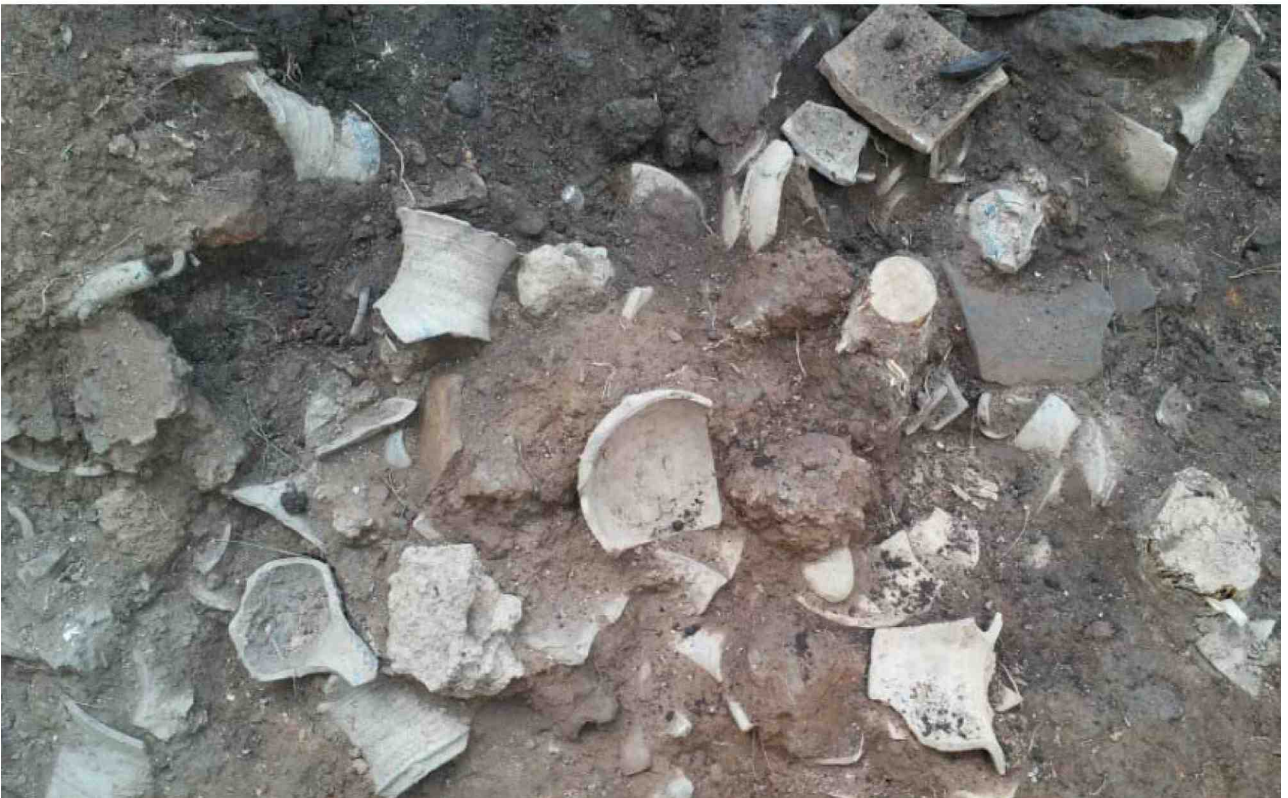
사진 3. 폐기장 유물 노출 상태