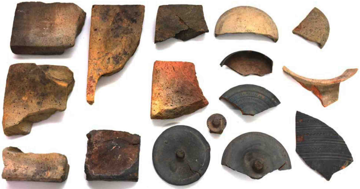
사진 5. 토기가마 2호 출토 전 및 토기류