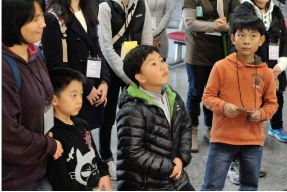
집중해서 설명듣고 있어요(국립김해박물관)