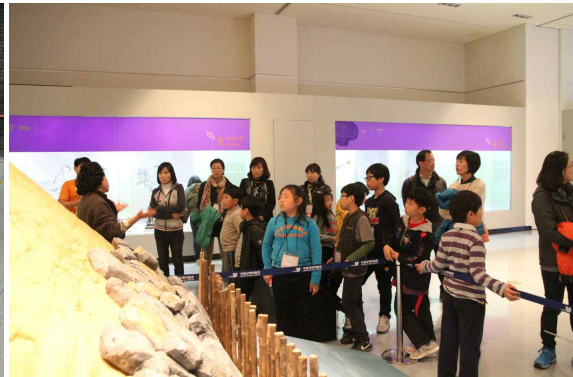
해설사 선생님과 함께(국립김해박물관)