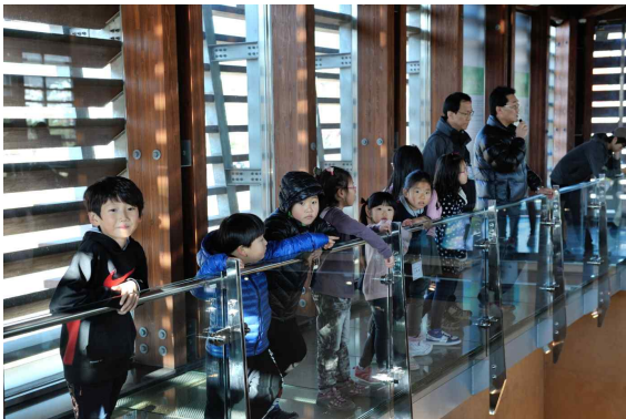
조상들의 무덤은 어떻게 생겼나요(대성동고분군)