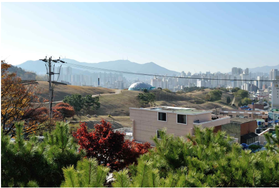
부산 북천박물관 야외전시실 및 북천동고분군