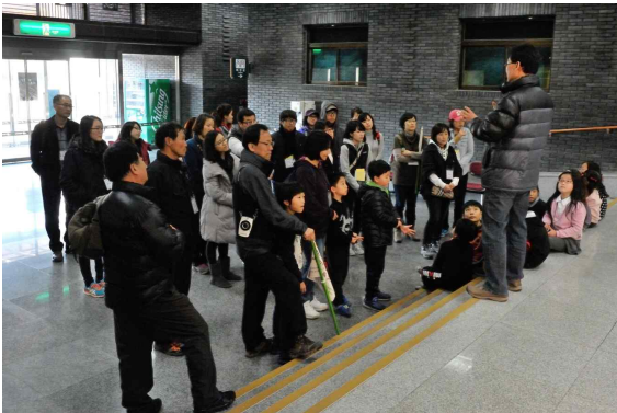
강사선생님의 상세한 설명(국립김해박물관)