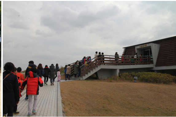
김해 대성동고분군 야외노출전시관