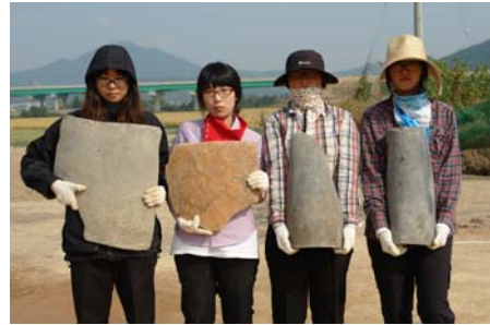
▲ 기와가마 출토 초대형기와