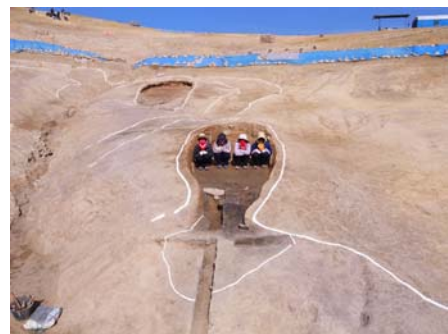
▲ 2호 기와가마 전경