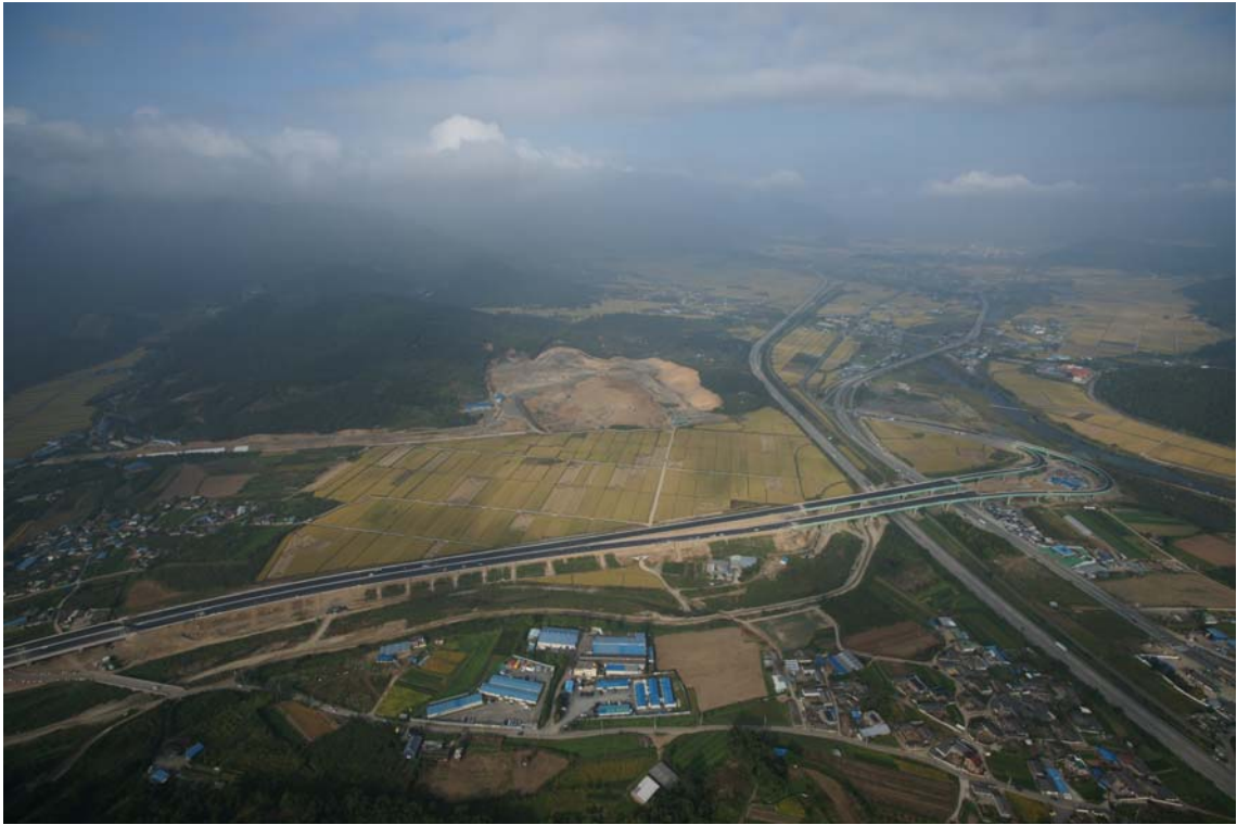
▲ 유적 원경