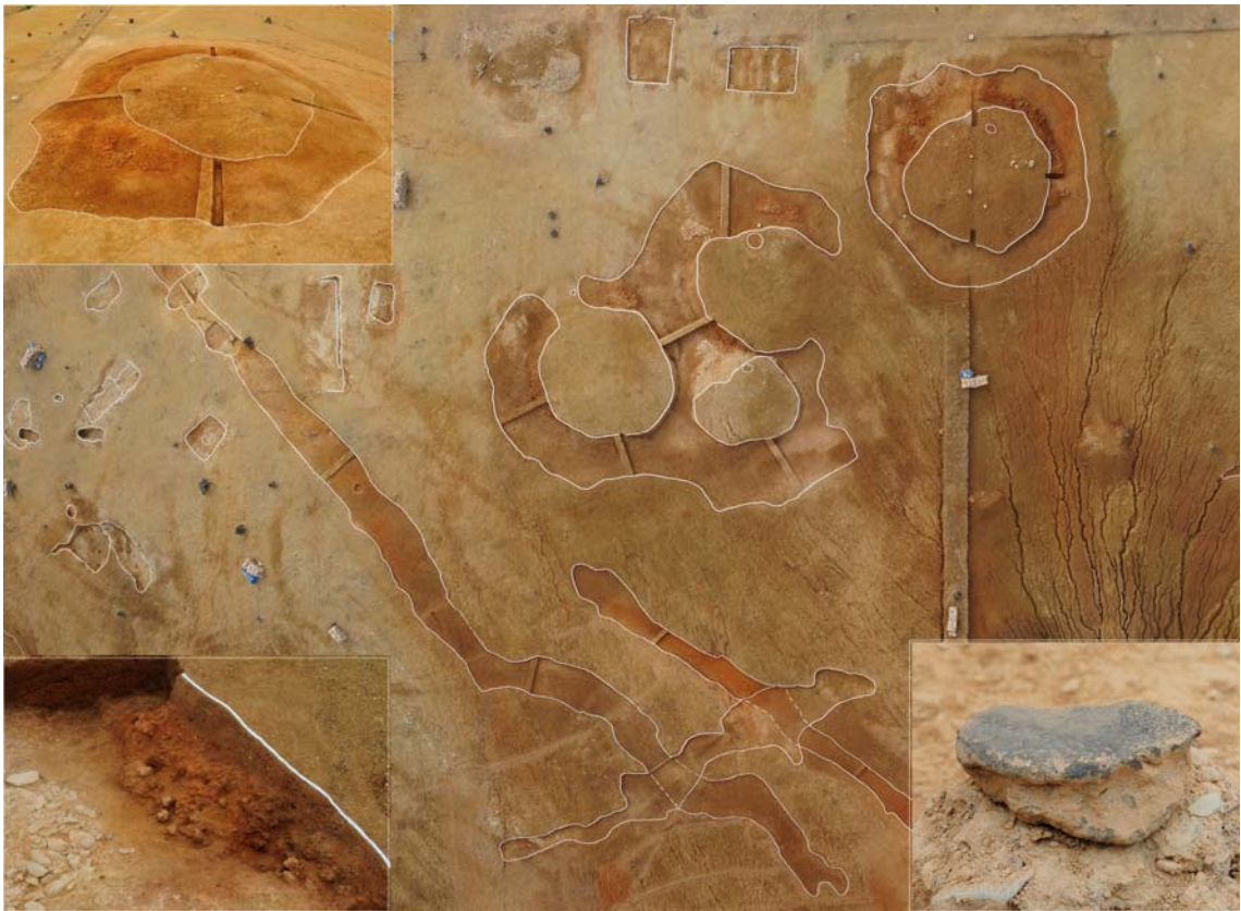
▲ 주구형 유구