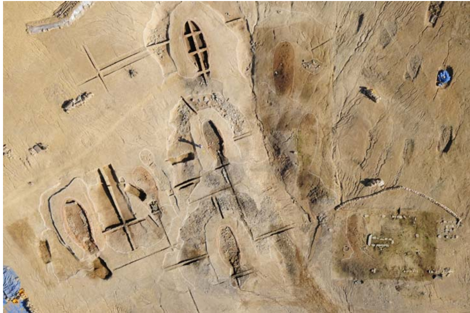
▲ 기와가마 조사전경